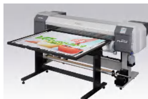
ロール&フラット印刷に対応！

非インクジェット用素材に対しての作画が可能。 インクの伸びる性質を活かし熱成型にも使用可能。